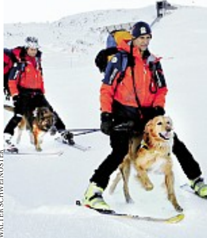
Disziplin im Schritt: Folgsamkeit ist alles